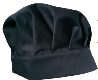
Cappello cuoco basso