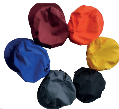
Cappellino con velcro e visiera