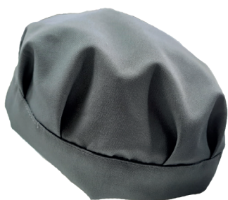
Cappellino con velcro