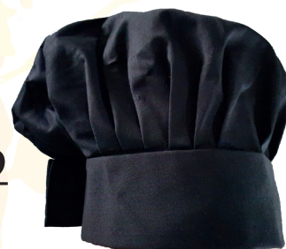
Cappello cuoco alto